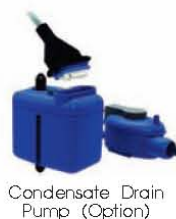
Condensate Drain Pump (Option)