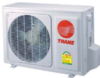
ชุดควบรวมวาล์วมีตั้งแต่ขนาด 9,400-18,300 Btu/h